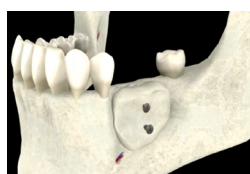
Mise en place de la greffe