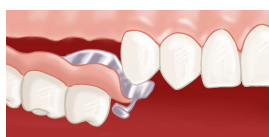
Insertion de la prothèse à châssis métallique